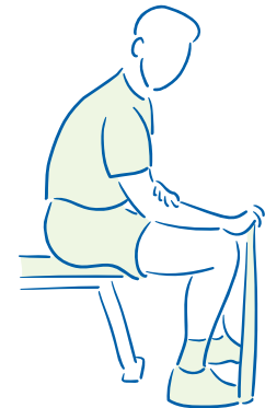
figuur 4. Versterken van de polsstrekkers