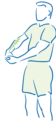
figuur 2. Rekken van de polsstrekkers