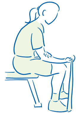
figuur 3. Versterken van de polsbuigers